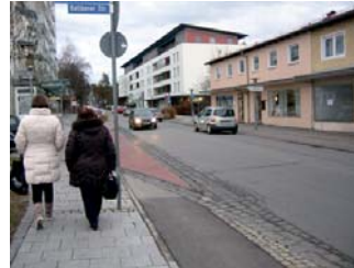
1.3. Kreuzung Berliner- und Ratiborer Str.