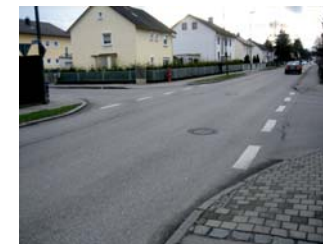
1.7. Kreuzung Zeppelin- und Daimlerstraße