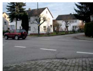
1.6.: (Kreuzung Schicht- und Daimlerstraße)

Suchen Sie mit Hilfe des Schulwegplanes gemeinsam den verkehrssichersten Weg zur Schule. Dabei sollten sie folgende Regeln beachten: - Ihr Kind sollte die Fahrbahn möglichst wenig überqueren müssen, - Wenn eine Straße überschritten werden muss, sollte das grundsätzlich an Kreuzungen oder Einmündungen geschehen, nicht an Streckenabschnitten dazwischen, - Straßen mit starkem oder schnellem Verkehr sollten möglichst an den Stellen überquert werden, die durch eine Ampel oder einen Zebrastreifen gesichert sind.