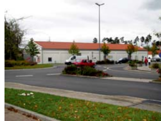
1.1 Kreisverkehr Teplitzerstraße und Traunreutherstraße