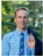
Robert Pöttsch Erster Bürgermeister

Den sichersten Schulweg finden Sie natürlich am besten mit Ihrem Kind zusammen. Dieser Schulwegplan will Ihnen dabei helfen, indem er bekannte Gefahrenstellen aufzeigt. Für die Mitwirkung an der Erstellung dieses Planes möchten wir uns beim Gymnasium Waldkraiburg bedanken, die ihn im Rahmen einer Projektarbeit ausgearbeitet haben. Die Stadt Waldkraiburg sowie Ihre Schule und die Elternbeiräte wünschen allen Schulkindern, dass ihnen nichts passiert.