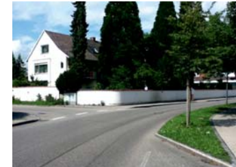
1.8. Kreuzung Daimler- und Lindenthalstraße