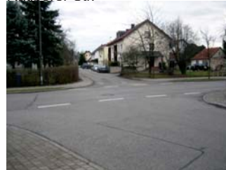
1.5. Kreuzung Josef-Ressel- und Daimlerstraße