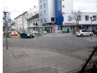
1.2. Kreuzung zwischen Braunauer Str. und Berliner Str.