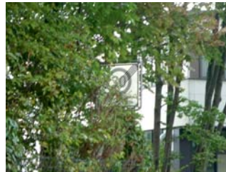
4.4 Mendelweg Einmündung zur Siemensstraße