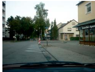
4.5: Kreuzung Grüner-Weg Schillerstr. und Peter Rossegger-Straße