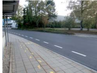
4.3 Übergang bei der Siemensstr. a. d. Abzweigung z. Nansenweg