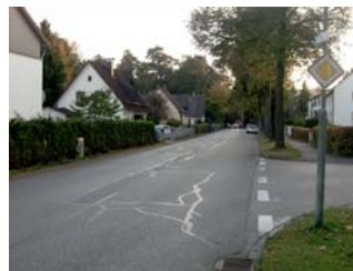
4.6. Grüner-Weg Einmündung in E. Eschenbacher Straße und dahinter G. Hauptmann-Weg