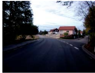
4.1 und 4.2 Einmündung Jahnstr. in Heldensteiner Straße