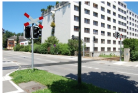
3.5. Bahnübergang in der Aussigerstraße