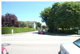
3.4. Kreuzung Erzgebirgsstraße, Veichenweg und Aussigerstraße.