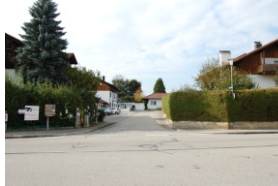
3.2 Einmündung Danzingerstraße in die Von-der-Tann-Straße