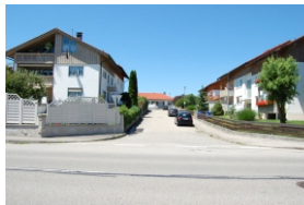
3.3 Einmündung Tropbauerstraße in die Von-der-Tann-Straße.