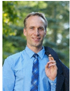
Robert Pöttsch Erster Bürgermeister

Die Stadt Waldkraiburg sowie Ihre Schule und die Elternbeiräte wünschen allen Schulkindern, dass ihnen nichts passiert.