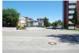
3.1 Kreuzung Danzingerstr., Warnsdorferstr. und Von-der-Tann-Straße